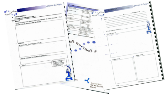
Imatge 2: Guies didàctiques utilitzades.

Es disposa també d'un dossier complementari que ajuda a completar i ampliar informació.